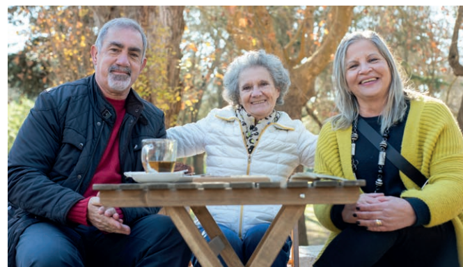
Bijna met pensioen

Als u in het buitenland woont en pensioen ontvangt, dan hebben wij elk jaar een "bewijs van in leven zijn" (Attestatie de Vita) nodig. Dit bewijs moet ingevuld worden door een bevoegde (overheids) instantie, zoals een gemeenteambtenaar of een notaris. Hiervoor nemen wij jaarlijks contact met u op.